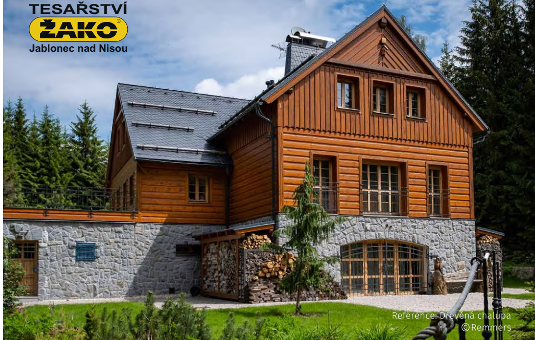
Reference: Dřevěná chalupa